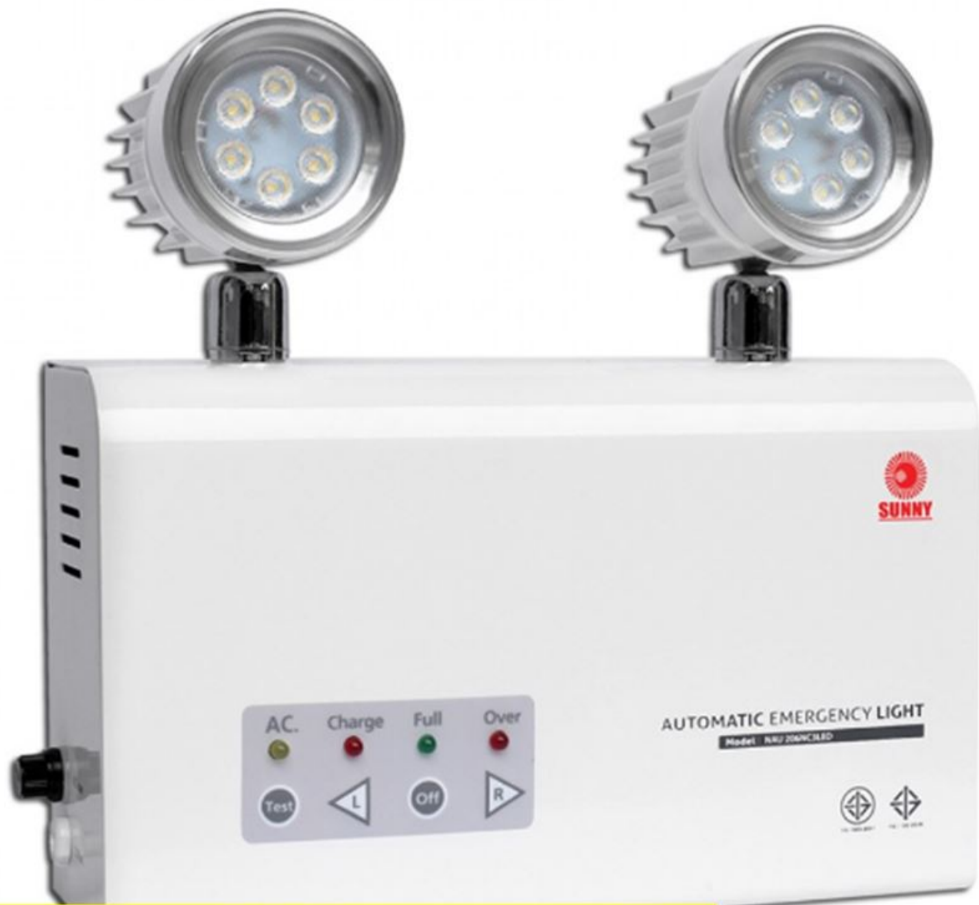
รุ่น NAU 203 NC 5 LED